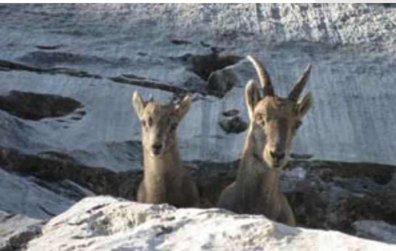
Ankunft am Sektor «Pfaffenhuet», neugierig beobachtet von jungen Steinböcken.