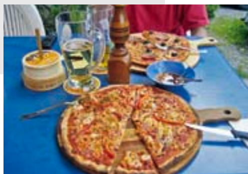
Pizza im Basislager.

Die nachhaltige Befriedigung, die sich nach einer Wendenklettertour einstellt, kommt nicht nur von der tadellosen Felsqualität und dem tollen Ambiente, sondern auch davon, dass man sich einer persönlichen Herausforderung gestellt und diese dank den eigenen Fähigkeiten gepackt hat. Nur: Ein gutes Kletterniveau in der Halle oder im Klettergarten ist zwar sicher hilfreich, aber an den Wendenstöcken noch keine Garantie für den Erfolg. Der lacht Kletternden, die mit der richtigen Kombination von Selbstsicherheit, Eigenverantwortung und Respekt einsteigen. Während zahlreiche Klassiker in der übrigen Schweiz in den letzten Jahren eifrig saniert und mit kistenweise zusätzlichen Bohrhaken bestückt wurden, blieben die Wendenstöcke nämlich von solchen Aktionen verschont. Bloss einige ältere Routen, beispielsweise Blaue Lagune , Inuit oder Excalibur , wurden inzwischen sanft saniert, wobei grosser Wert darauf gelegt wurde, den Routencharakter beizubehalten. Wenn man mit der nötigen Umsicht einsteigt, kann das Verletzungsrisiko auch in den wilden Routen klein gehalten werden. Ein gradioses, nachhaltiges Klettererlebnis ist hingegen fast immer garantiert.