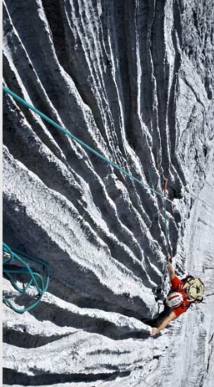
Messerscharfe Wasserrillen findet man in mehreren Routen an den Wenden. Hier in Virus am Sektor «Reissend Nollen».